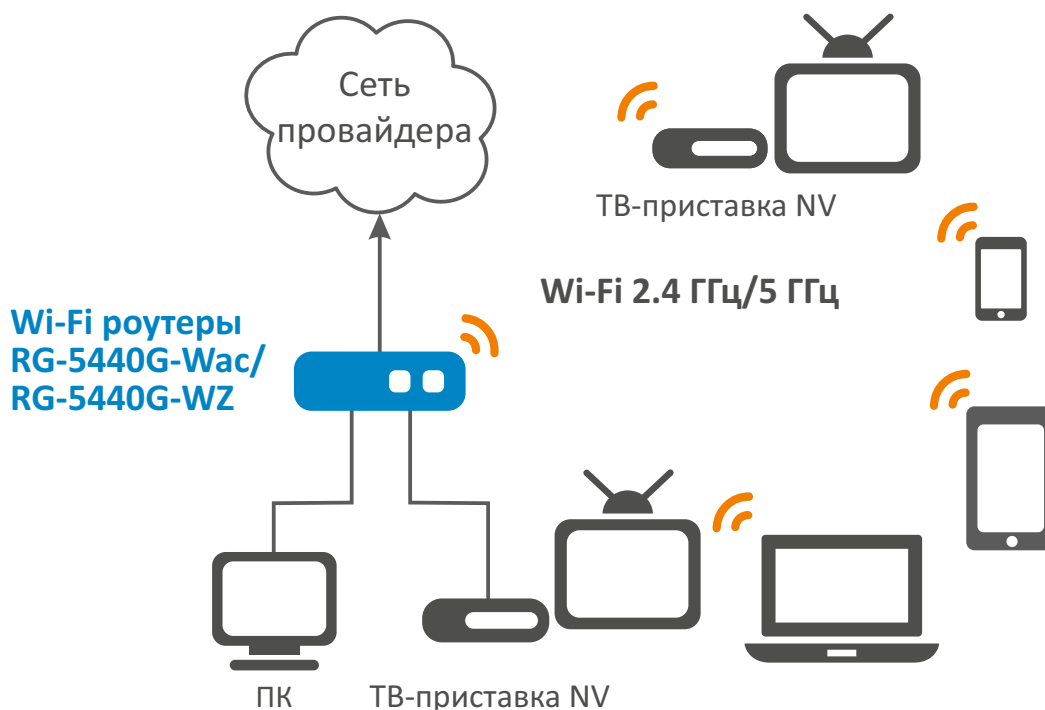
Схема решения Wi-Fi Easymesh